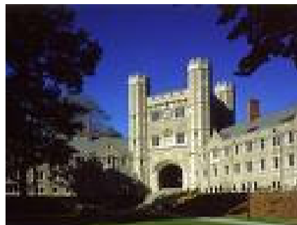
Universidad de Princeton, New Jersey

Me sentí profundamente desanimado ante éste y otros fracasos similares en mis esfuerzos por convertir a mis amigos al Cristianismo, y discutí el problema con mi maestro de la Biblia. ‘¿Qué pasa conmigo? ¿Es mi personalidad o necesito más tiempo para reunir mejores argumentos?’ En vez de darle